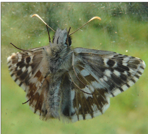
Onderkant Bretons spikkeldikkopje (♂).

Meteen zakten we terug af naar de plaats van de vondst en - pas toegekomen - zag ik meteen een ander vers exemplaar zitten op de zeer korte vegetatie. Het dikkopje was me echter te snel af toen ik het probeerde te netten, maar de toon was gezet. We hadden met zekerheid twee exemplaren gezien waarvan één bevestigd mannetje. Omdat we nog naar Frankrijk moesten en door de historische vondst achter liepen op het schema - het was al bijna 18 uur -, besloten we niet verder te zoeken, maar op een andere keer terug te komen. Tijdens de autorit begon het pas echt tot ons door te dringen dat dit een nieuwe vondst was voor België. Zouden er nog meer vindplaatsen zijn in België? Waarom zat het Bretons spikkeldikkopje dàar en niet bv. in het voor de hand liggende reservaat in Torgny? 'Het microklimaat en de kort afgegraasde plekjes' was onze eerste antwoord. Dit was een Pyrgus -vallei! Waren dit zwervers of was het een populatie? Twee zwervers op exact dezelfde plaats? Neen toch! Dat kon toch niet... Aan onze stemmen kon je horen dat we zo gelukkig waren als kleine kinderen.