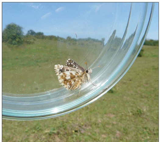
Onderkant Bretons spikkeldikkopje (♀).