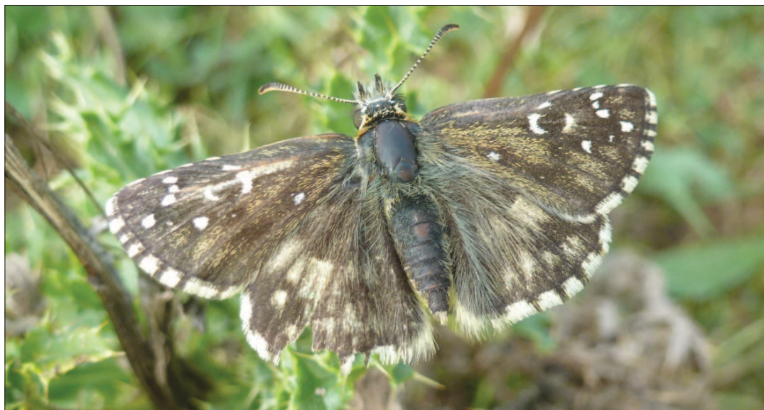
Vers exemplaar Bretons spikkeldikkopje (♀) wat kan duiden dat voortplanting zeker mogelijk is.