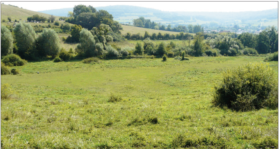
Extensieve begrazing in de vallei zorgt voor een mooie afwisseling tussen ruigtes, struwelen en kortbegraste stukken.